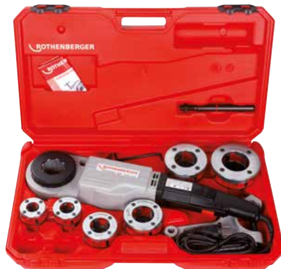
Sada SUPERTRONIC® 2000