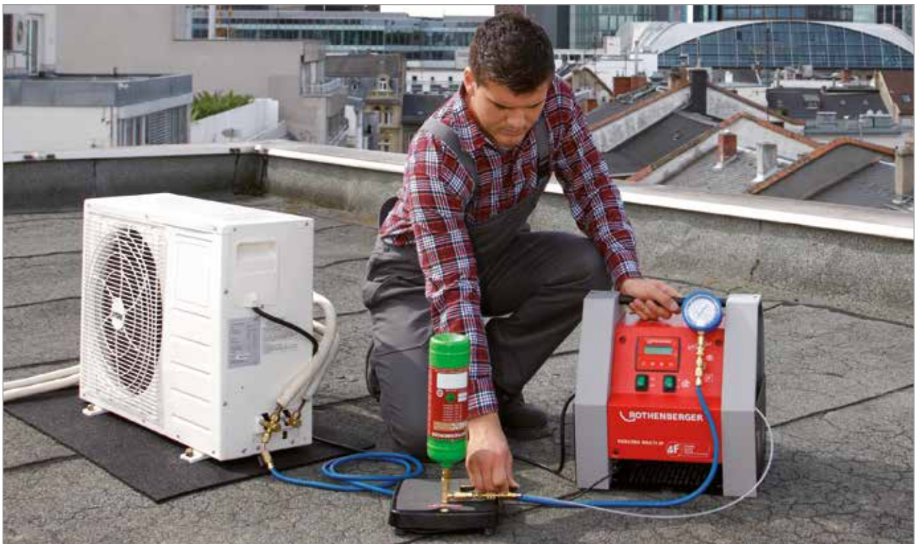
ROKLIMA® MULTI 4F při použití (evakuace & plnění)

Dodáváme (obj.č. 1000000138) včetně: dvoustupňové vysokovakuové vývěvy, 2 nízkotlakých manometrů, 1 vysokotlakého manometru R410A, 2 tlakových hadic s kulovým kohoutem à 2.500 mm, 2 přípojek lahví (1/4" SAE obj.č. 173205, 5/16" SAE obj.č. 173204), 2 redukce 1/4" SAE - 5/16" SAE (obj.č. 170016), přesné digitální váhy do 100 kg, automatického ovládání, vakuového a tlakového spínače, minerálního oleje (obj.č. 169200)